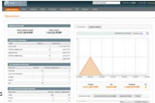
La fiche proa