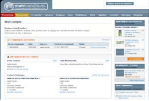
Le compte client